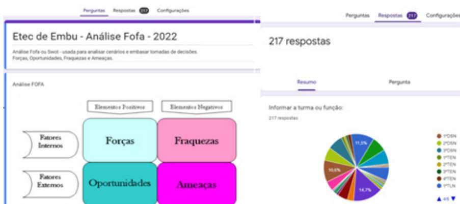
Figura 4 - Planejamento

Para organizar as etapas das metas a serem cumpridas, foi importante conhecer o planejamento estratégico (responsabilidade dos níveis mais altos da empresa), tático (utilização eficiente dos recursos disponíveis para alcançar os objetivos estabelecidos) e operacional (preocupação com o alcance das metas específicas). Na figura abaixo, como poderia ser: