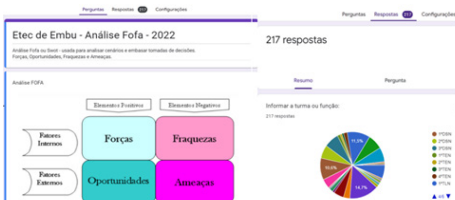
Figura 3 - Análise Fofa da Etec de Embu

As mudanças propostas podem ser seguidas com a intenção de resultados melhores nas atividades rotineiras da instituição. Além disso, as propostas proporcionaram motivação aos envolvidos, agilidade na realização dos serviços, credibilidade à equipe e melhoria contínua.