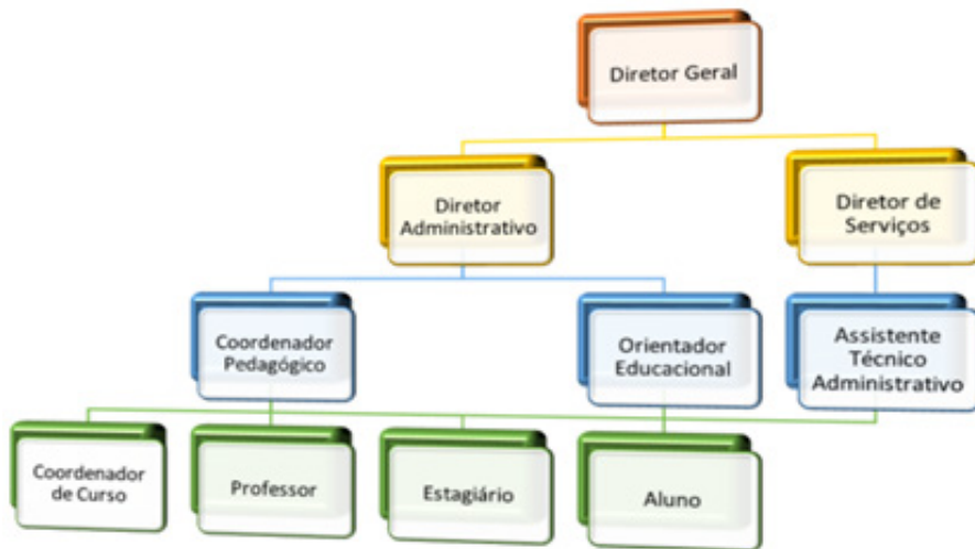
Figura 1 - Estrutura Organizacional da Etec de Embu

Assim, segue a apresentação gráfica, demonstrando um organograma da Etec de Embu: